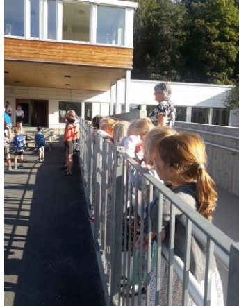
Jupiterne spionerer på første skoledag.

Bygdas barneskole er vår nærmeste nabo, og vi har et tett og godt samarbeid med dem. Vi har faste møtepunkter gjennom hele det siste barnehageåret, og er blant annet invitert på «morgensamling» på skolen en gang i måneden. På denne måten blir barna kjent med skolen, og de blir godt rustet og forberedt til skolestart. Vi opplever at dette har stor betydning for hvordan skolestart oppleves for både barn og foreldre. Lillehammer kommune har en egen plan for overgang barnehage- skole som vi følger.