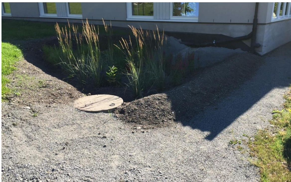
Eksempel på fordrøyningsbed for takvann (Vea Planteskole).

Internt innen planområdet er det viktig at alt vann som genereres på egen tomt fordrøyes lokalt, da det ikke er ønskelig å belaste nedstrøms områder og fortrinnsvis ikke kommunalt overvannsnett. Nederst på tomten er det regulert 600 kvm med uteoppholdsareal som en del av den helhetlige grøntstrukturen. På dette arealet er det tenkt etablert en naturlig fordrøyningsbasseng eller fordrøyningsbed som en del av den naturlige helhetlige grøntstrukturen på tomten. Dette arealet er så stort at det er helt uproblematisk å ivareta de vannmengdene som genereres innen området. Under vises et eksempelbilde på hvordan dette kan håndteres: