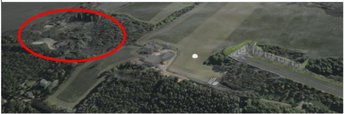
Figur 7 Illustrasjonsbilde av mulighet for mellomlagring av tunnelmasser også ved Søndre Trosset