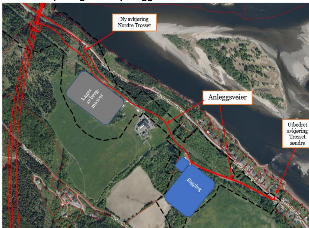
Figur 4 Illustrasjonsbilde av tiltenkt mellomlagringsområder samt anleggsvei fra tunnelpåhugg Nord ved Trosset.