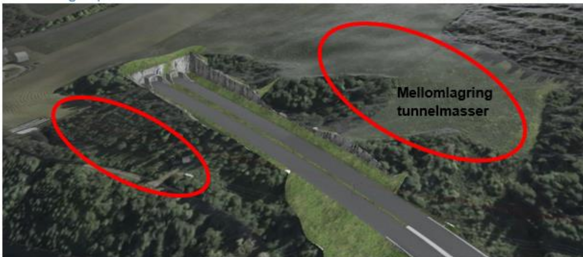
Figur 6 Illustrasjonsbilde av mulighet for mellomlagring av tunnelmasser ved KDP løsning for Vingnestunnelen og KDP Kryssløsning Lågen