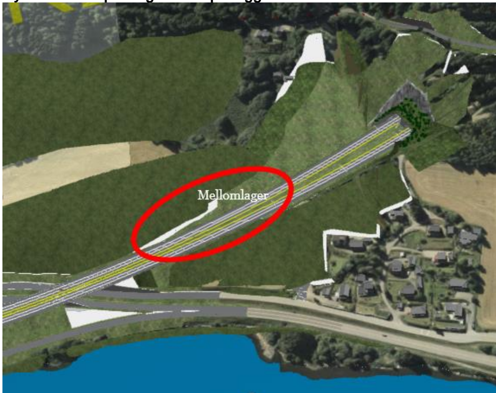
Figur 3 Illustrasjon av mellomlagringsområdet ved Øyresvika og Vingnes. Tunnel påhugg Sør.