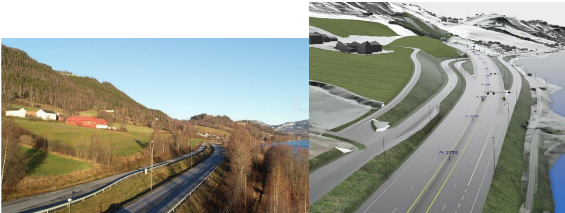
Figur 2 Illustrasjonsbilder for prosjektert optimalisering av jordbruksarealer ved Bulung gård i Øyresvika

Overskuddsmasser og håndtering av disse kommer frem i fagrapport og plan for matjord. RAPP-nar-001_Matjordplan.docx