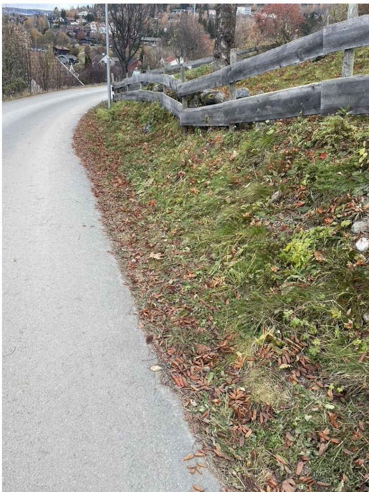
Figur 2 viser dagens situasjon på Gjøstivegen langs gnr/bnr 85/23.

Et effektivt tiltak kan være å foreta en breddeutvidelse/forsterke vegskulder på østsiden av vegen. På dette punktet er Gjøstivegen ca. 3,6 meter bred. Fra dagens vegskulder til eiendomsgrense er det på den aktuelle strekningen en avstand fra 80 til 260 cm. Dette vil si at det kan gjennomføres en breddeutvidelse som kan innebære at to biler kan møtes, samt siktforholdene gjennom svingen kan bedres. Gjennom dette oppnår en også i større grad å skille mellom kjøretøy og myke trafikanter.