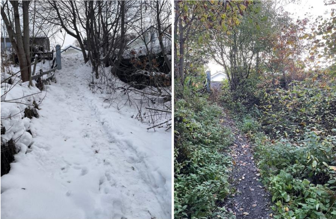
Figur 4 viser strekningen ned fra Gjøstivegen for turstien mellom Tverrløypa og Gjøstivegen både om vinteren og sommeren.