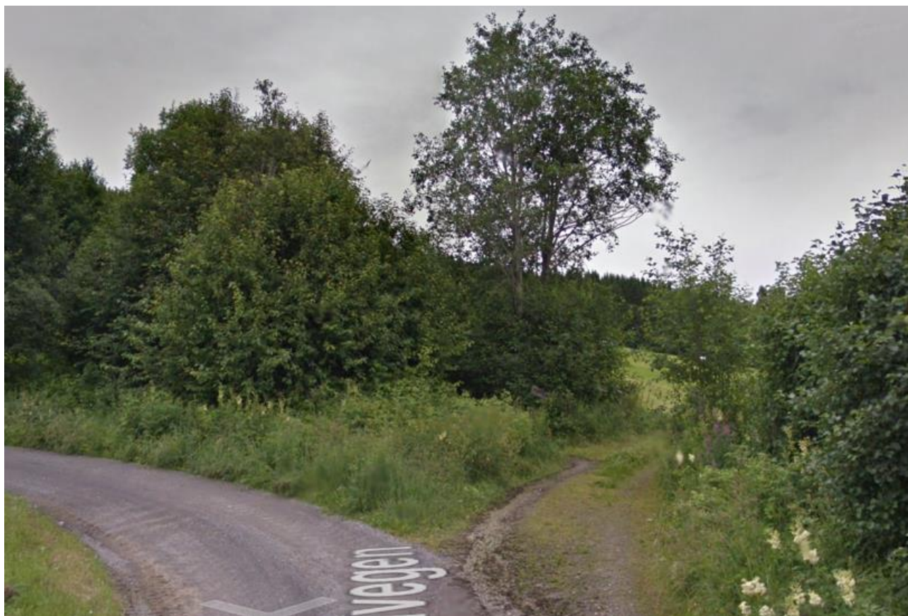
Figur 5 viser hvor «Tur 8» kommer inn på den private delen av Gjøstivegen (Google maps).

Som det framgår av figur 3 kommer turstien Tur 8 ned på Gjøstivegen i ytterkant av svingen. Turstien benyttes i stor grad av gående, men også av syklende. Det kan forekomme syklistere som kan komme overraskende ut på den private delen av Gjøstivegen noe som kan skape trafikkfarlige situasjoner. For å redusere hastigheten på syklende kan eksempelvis tiltak som å etablere en sjikane ha en positiv effekt på dette.