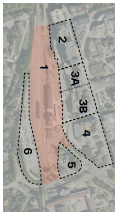
Figur 3: kvartaler i delområde Skysstasjonen

Forskrift om konsekvensutredning § 6b stiller krav til konsekvensutredning og planprogram for reguleringsplaner som omfatter tiltak i forskriftens vedlegg I. Planinitiativet utløser krav til konsekvensutredning, jf. forskrift om konsekvensutredning vedlegg I, nr. 24 «Næringsbygg, bygg for offentlig eller privat tjenesteyting og bygg til allmenntilrettelegging med et bruksareal på mer enn 15.000 m 2 ».