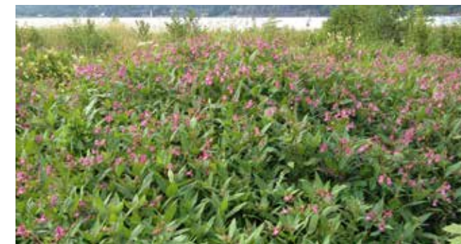
Kjempestspringfrø trives der det er litt fuktig og frøene kan spres langt via vann.

SPREDNING: Planten har stor frøproduksjon og sprer seg raskt med frø som «slynges» opp til 7 meter ut fra morplanten. Frøene spres lett via vann eller ved at de følger med jord. Avkappede plantedeler har kort levetid, men kan også slå rot.