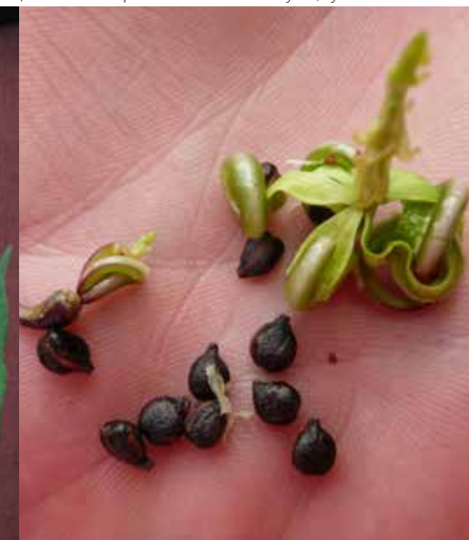
Kjempespringfrø sprer seg raskt med frø som "slynges" opptil 7 meter fra morplanten.

utsetting. Blant forbudsplantene finner vi mange vanlige hageplanter. Det nye regelverket har ikke tilbakevirkende kraft slik at du må fjerne dem fra hagen, men du må være særlig aktsom slik at de ikke spres fra din hage.