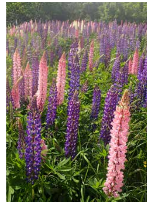
Pollen fra lupiner reduserer formeringsevnen til humler.

SPREDNING: Formerer seg både med jordstengler og frø. Hver plante kan produsere flere hundre frø. Frø kan ligge i inntil 50 år i jorda uten redusert spireevne. Spres lett ved flytting av jord.