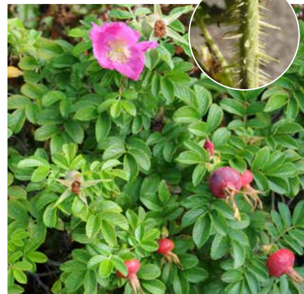
Blomstene til rynkerose danner store nyrer på høsten. Fuglene spiser frøene og kan spre dem langt. Nypene spres også via vann. Innfelt foto: Rynkerosen har tett med tornet, det skiller dem fra de viltvoksende rosene.

SPREDNING: Formerer seg både med rotskudd og frø. Frøene spres med fugl og nypene flyter i sjøen til nye vokseplasser langt vekk fra morplanten. Spres ved flytting av jord.