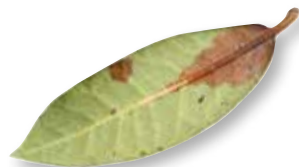
Phytophthora Ramorum.

BLINDPASSASJERER PÅ HAGEPLANTER: Noen kan kanskje fristes til å ta med seg en spennende plante eller stiklinger hjem fra utlandet for å dyrke i sin egen hage. Det er viktig at alle vet og tar på alvor at slikt materiale kan ha med seg uønskede følgeorganismer. De fleste hageeiere kjenner for eksempel godt til brunskogsnegl. I Norge har vi strenge regler for innførsel av planter og plantemateriale. Privatpersoner oppfordres til ikke å ta med hjem planter og plantemateriale ved utenlandsreiser. De som likevel har