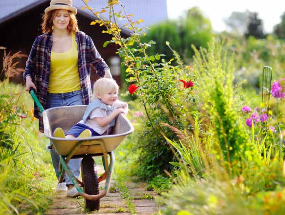
Hagearbeid er hyggelig for store og små. Med god planlegging kan dere få en hage der plantene ikke «rømmer».