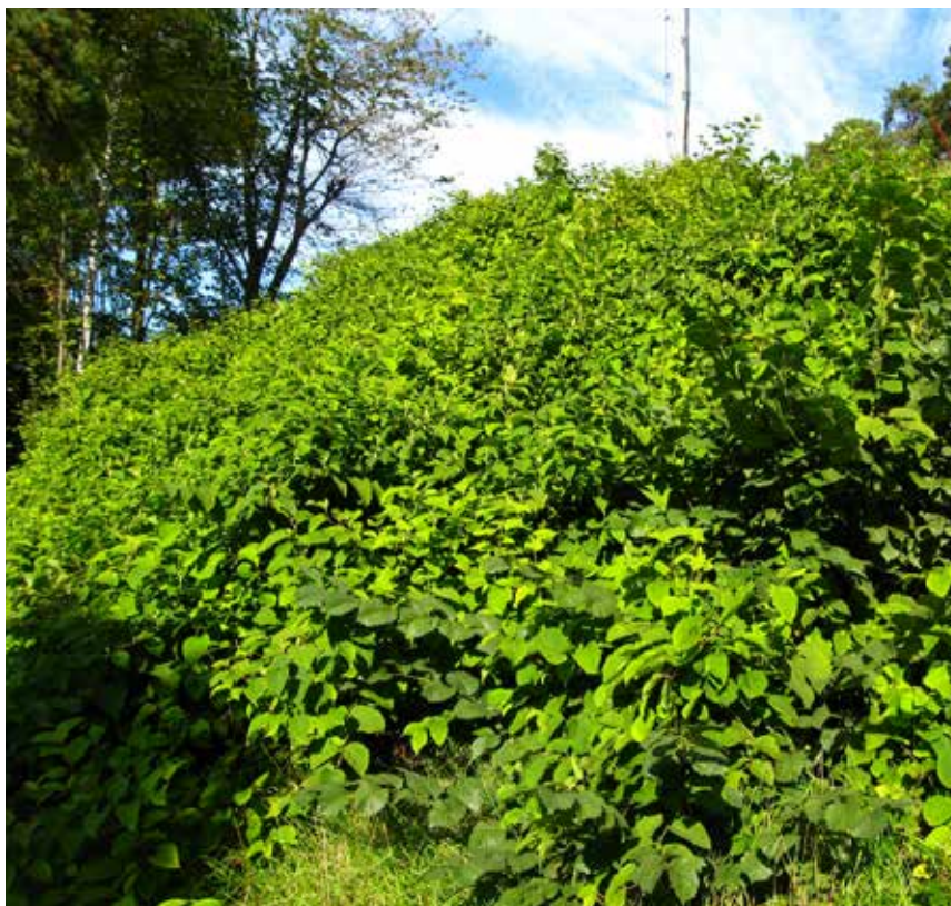
Parkslirekne danner tette bestander som skygger ut alt under.

SPREDNING: Formerer seg raskt med krypende jordstengler og med biter av stengler. Biter av jordstenglene kan spres ved flytting av planter og jord, maskiner og via vann.