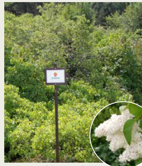
Syrin kan gjerne stå i hagen, men når den spres i naturen er den et stort problem. Her fra Lindøya naturreservat.

SPREDNING: Sprer seg mest med rotskudd som gir opphav til nye planter, men sprer seg også noe med frø.