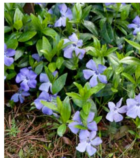
Blomstene til gravmyrt setter ikke frø i Norge, men planten sprer seg ved hjelp av krypende, rotslående stengler.

BEKJEMPELSE: Luking (inklusive underjordiske deler) som gjentas, eventuelt tildekking med lystett duk i minst ett år.