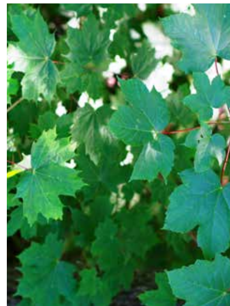
Platanlønn (til høyre) har buttere blader en vår hjemlige spisslønn (til venstre).

SPREDNING: Planten har frøspredning, men røttene kan utvikle nye planter hvis de deles opp eller forstyrres, for eksempel ved graving. Flytting av jord som inneholder frø, røtter eller biter av røtter sprer planten til ny voksesteder.