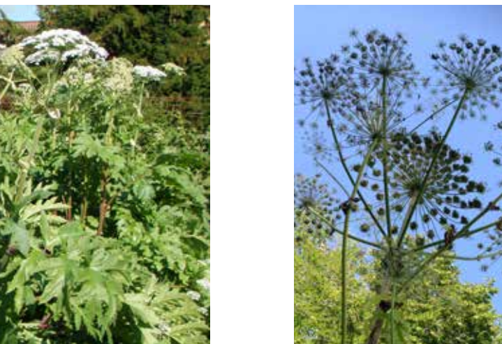
En plante av kjempebjørnekjeks kan ha 50.000 frø som kan være spiredyktige i 7-10 år.

Oppfølging senere i sesongen på nyspirte planter.