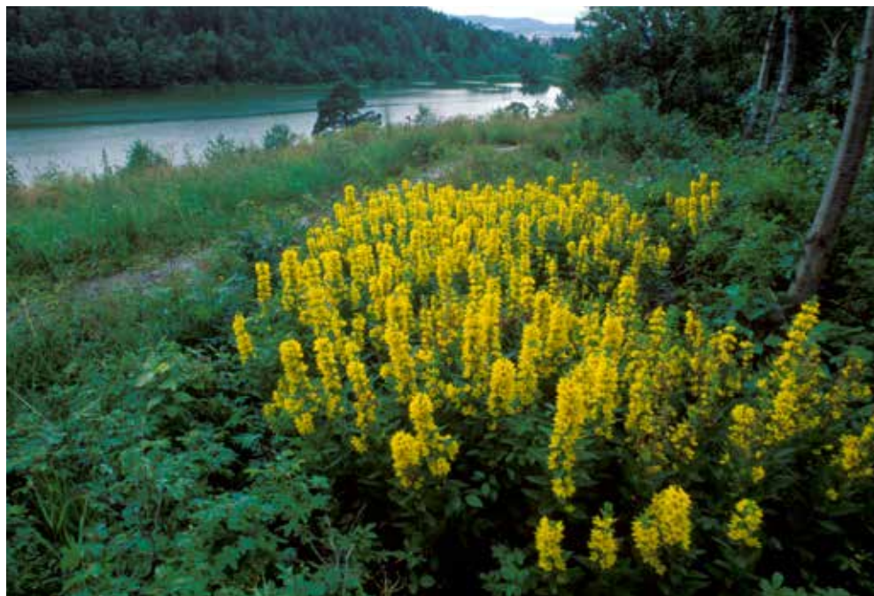
Fagerfredløs har spredd seg ut i naturen fra der hageavfall har blitt kastet.