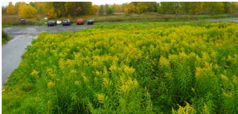
Kanadagullris sprer seg med frø og krypende jordstenger, og danner ofte tette bestander.