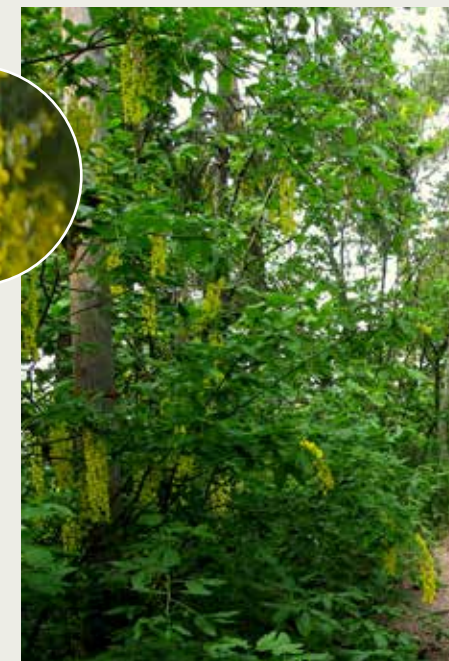
Gullregn på Malmøya, Oslo.