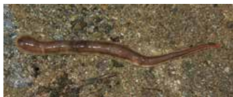
New Zealandsk flatorm.