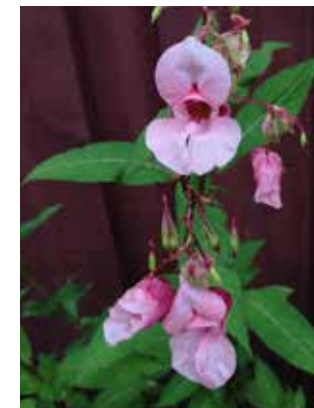
Frøkapslene til kempestspringfrø «eksploderer» ved berøring og slynger ut frøene.

UTSEENDE: Ettårig, hurtigvoksende plante, opp til 180 cm høy med hul saftig stengel. Bladene er sagtannede, mørkegrønne og sitter motsatt, eller tre i krans og har kjertler ved grunnen. Hvite til mørk rosa blomster. Blomstring og frøsetting fra juli til frosten kommer. Springfrøfamilien.