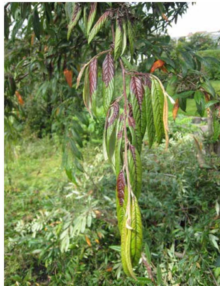
Symptomer på pærebrann på pilemispel.

PÆREBRANN: En alvorlig sykdom på epler, pære og prydbusker i rosefamilien. Den er forårsaket av bakterien Erwinia amylovora . Sykdommen finnes på Vestlandet og Sørlandet, og har ført til omfattende fjerning av planter som er mottakelige for smitte, også i private hager. Denne sykdommen gjør at det er forbudt å plante vertplantene