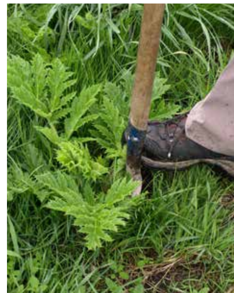
Kjempebjørnekjeks som spas opp.

På grunn av faren for at frø overlever bør man imidlertid ikke legge svartelistede planter i kompost hvis disse kan ha frukter eller frø. Disse bør klippes av og legges i tette plastsekker i restavfallet.