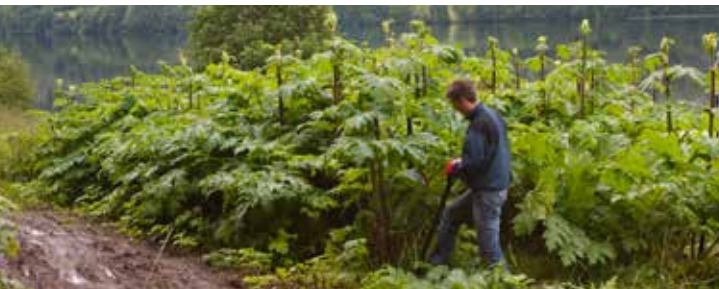
Rotkutting er en effektiv metode for å fjerne kjempebjørnekjeks.

BEKJEMPELSE: Rotkutting eller oppgraving tidlig i vekstsesongen, med oppfølgende tiltak utover sommeren på nyspirte planter og eventuelle nye skudd fra eldre røtter. På planter med blomster eller frø, klippes disse av og sendes til forbrenning. Bekjempelse må ofte gjentas, kanskje i 7-10 år på grunn av frø i bakken. Sprøyting på forsommeren, på 15-25 cm høye planter kan være effektivt mot kjempebjørnekjeks, men dreper også annen vegetasjon.