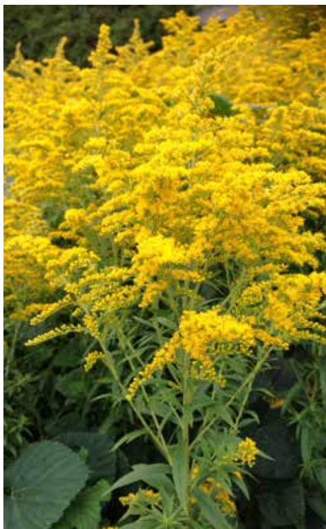
Hver plante av kanadagullris kan produsere opptil 10.000 frø som spres med vind. Blomstene bør klippes av for å hindre spredning.

SPREDNING: Spres med rotskudd, frø og stengelbiter. Stor frøproduksjon, disse er lette og spres med vind. Spres lett ved flytting av jord.