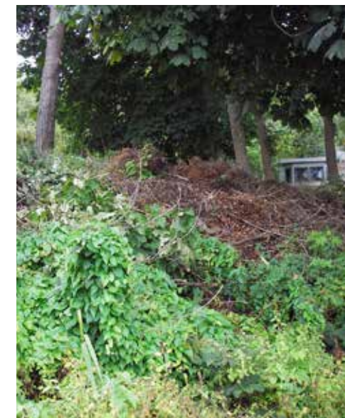
Fremmede arter i hager og dumping av hageavfall kan føre til spredning til naturen. På bildet ses både klatrevillvin, rødhyll, platanlønn, bøk og hestekastanje. Komposthaugen gir gode vekstvilkår.