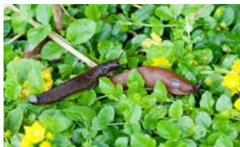
Brunskogsnegl kom til Norge som blindpassasjer med planter og jord.