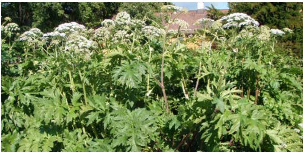
Kjempebjørnekjeks og tromsøpalme har begge store flikete blader og store skjærmer med hvite blomster. De tykke stenglene inneholder en giftig plantesaft som kan gi brannskader på hud.