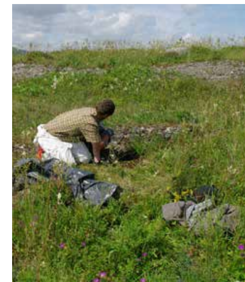
Fylkesmannens sommervikarer luker hageplanter i verneområder. Hvert år bruker forvaltningen i Norge millioner på å fjerne hageplanter som har forvillet seg inn i verneområder. Hageplantene konkurrerer ut sjeldne og truede planter.