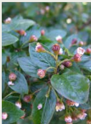
Blankmispel er den vanligste mispelarten som er forvillet i Oslofjorden.