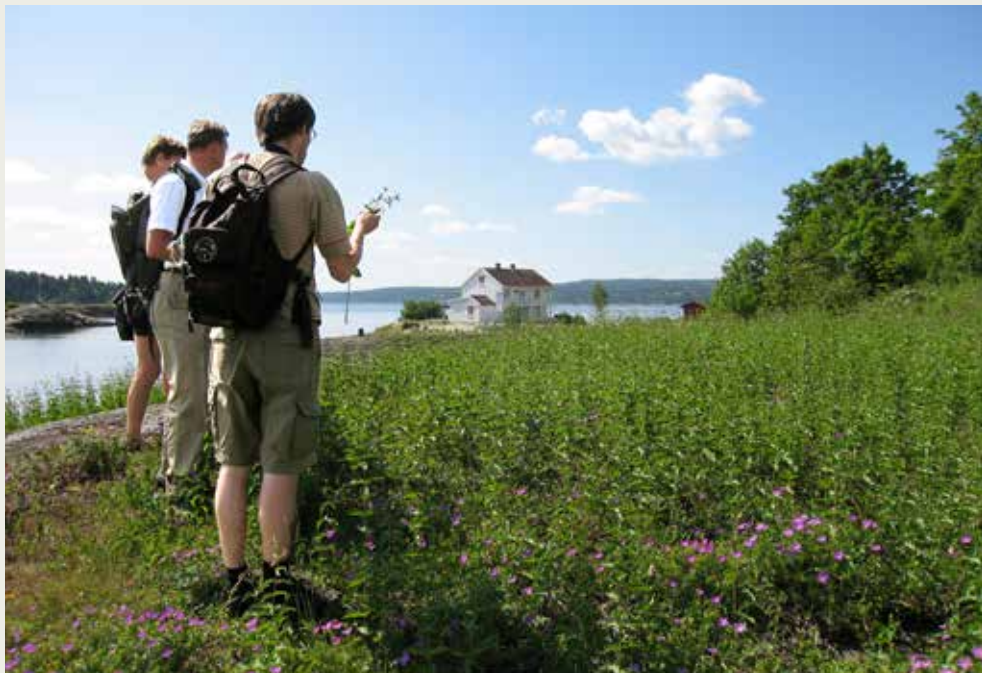
Russesvalerot har etablert seg i store mengder i verneområdene i Indre Oslofjord. Her fortrenger den sjeldne og truede planter.

Gunstig klima og kalk- og skiferrisk berggrunn gir grunnlag for en mangfoldig flora på øyene og i kystområdene i Indre Oslofjord. Indre Oslofjord har faktisk den mest mangfoldige artssammensetningen og den største forekomsten av truede arter i hele Norge. Rødlisterarter er arter som er sjeldne eller truet, og vil ofte være indikatorer på sjeldne eller truede naturtyper med store verneverdier. Dette livsmangfoldet blir forsøkt tatt vare på gjennom at områder vernes.