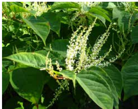
Blomstene til parkslirekne setter av og til frukt i Norge.