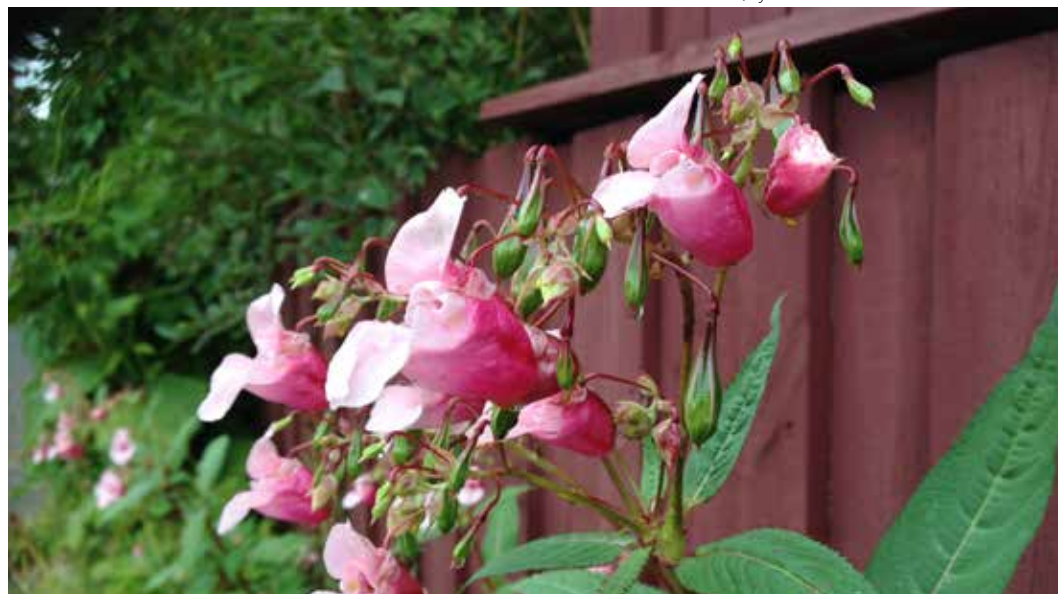
Kjempespringfrø «på rømmen» utenfor hagegjerdet.

I første omgang er det 28 planter som er blitt forbudt. Forbudet omfatter både import, salg og