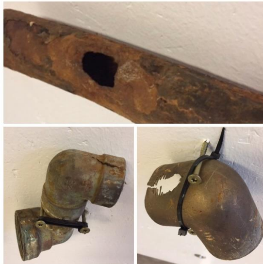
Deler av private vannledninger som ble byttet ut etter lekkasje.

Straks vannlekkasjen er stanset, sender den godkjente rørleggerbedriften ferdigmelding til kommune via den elektroniske søkesiden