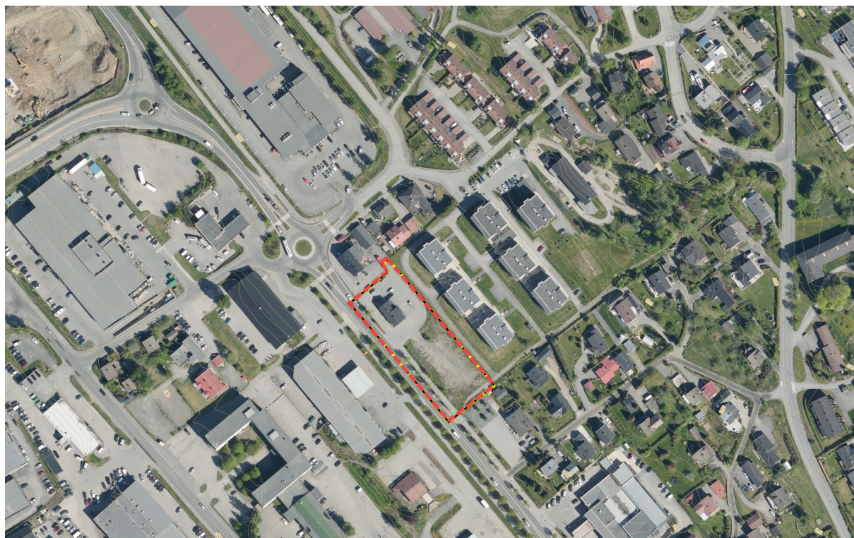
Planområdet – Gudbrandsdalsvegen 199

Planområdet er avgrenset av Gudbrandsdalsvegen (senterlinje) i sørvest, gnr./bnr. 41/44 i nordvest (MC Lillehammer AS), 53/380 i nordøst (Hammermo Terrasse – nedre) og 53/83 i sørøst. Se kart nedenfor for planavgrensning.